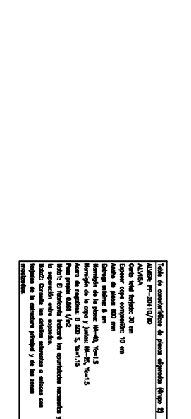
FORJADO DE GRADAS